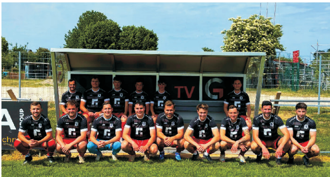
Das Ergebnis: Hochwertige Bänke und zufriedene Auswechselspieler.

Besonders schön: Das Projekt wurde von der Lehrwerkstatt umgesetzt. Eine echte Gemeinschaftsleistung, auf die jeder mächtig stolz sein kann. Gartner Extrusion zeigt damit einmal mehr, wie eng das Unternehmen mit der Region und dem Vereinsleben verbunden ist. Solche Unterstützung ist alles andere als selbstverständlich und wir schätzen sie sehr.