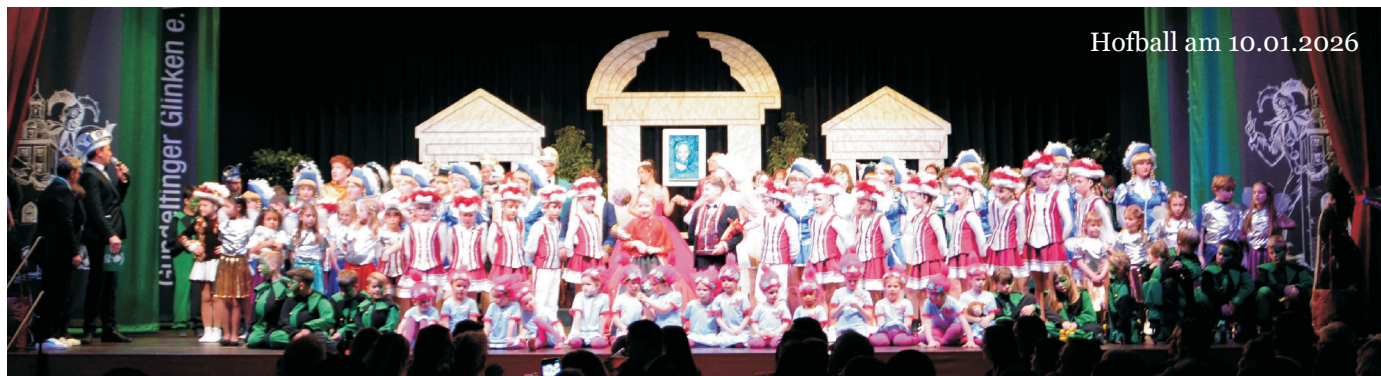
Hofball am 10.01.2026

HOT.N.SPICE-Ball 2026, 19.30 Uhr, Kath. Pfarrheim, TV Gundelfingen – Abteilungen Handball und Tanzsport