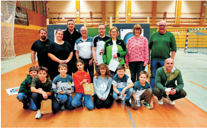
Teilnehmer des alljährlichen Weihnachtsschießen der Abteilung Bogen vom Schützenverein Gundelfingen 1754 e.V.

Am 17.12.2025 fand in der Kreissporthalle unser jährliches Weihnachtsschießen der Abteilung Bogen des Schützenvereins Gundelfingen 1754 e.V. statt. 15 Teilnehmerinnen und Teilnehmer ließen sich das Spektakel nicht entgehen. Es wurden in den Kategorien Blankbogen Herren, Blankbogen Damen, Compoundbogen Herren, Blankbogen Kinder und Blankbogen Jugend die Schützenkönige ermittelt. Diese erhielten als Sieg ein kleines Präsent. Mit Plätzchen und Punsch wurde anschließend noch ein wenig auf das nahende Weihnachtsfest angestossen.