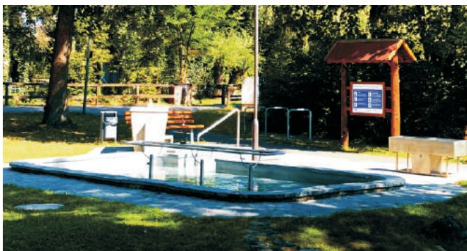
Kneipp-Anlage im Schnellepark

Im Jahr 1986 erfolgte Planung, Bau und Eröffnung der Kneipp-Anlage im Schnellepark. 1988 kam ein Armbecken für Kinder und Rollstuhlfahrer hinzu. 2001 legte Horst Matzke einen Fußreflexzonen-Parcours neben der Kneipp-Anlage an. 2018 wurde Hildegunde Risse-Scherm zur 1. Vorsitzenden gewählt, die sich dem Aufbau der fünf Säulen der Kneippschen Lehre Wasser – Bewegung – Ernährung – Heilpflanzen und Lebensordnung widmet.