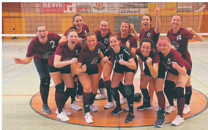
Riesenerfolg der Damenmannschaft

Die Volleyballgemeinschaft (FC/TV) Gundelfingen führt am Montag, 15. April 2024 um 20 Uhr ihre Jahreshauptversammlung in der Stadiongaststätte des FC Gundelfingen durch. Auf der Tagesordnung steht der Jahresrückblick der Vorstandschaft, die Entlastung und Neuwahlen. Wünsche und Anträge können schriftlich unter eoesser@web.de eingereicht werden.