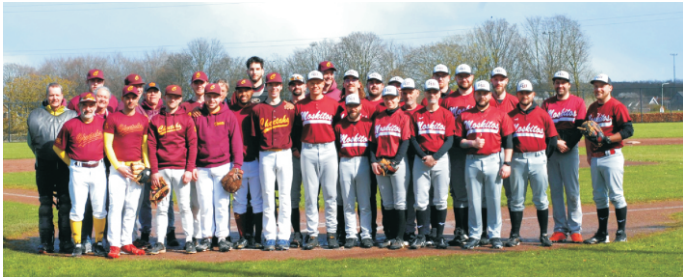
Cheetahs Beek & Gundelfingen Moskitos vor ihrem 1. Spiel