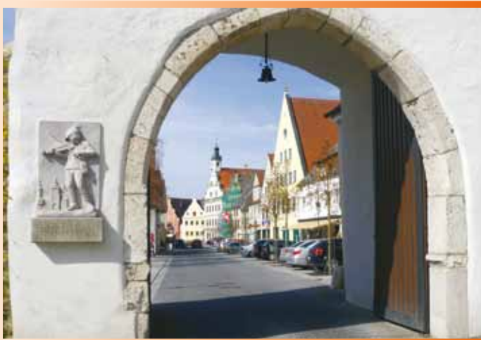
Ein Blick in die historische Altstadt Gundelfingens: Entdecken Sie Geschichte, Geschäfte und Genuss.