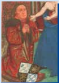
Herzog Ludwig IX. von Bayern-Landshut, genannt der Reiche

20.30 Uhr: Gesungene Stadtführung mit den Gundelfinger Nachtwächtern