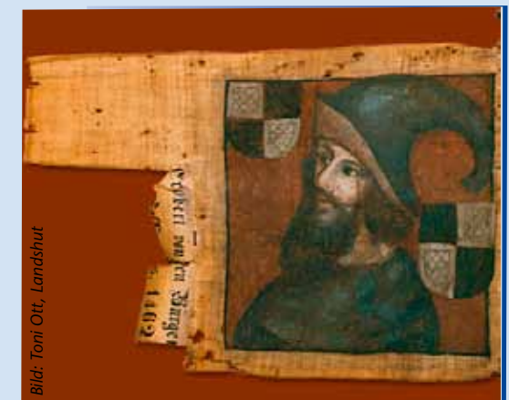
Sturmflagge des Markgrafen Albrecht Achilles, 1462 von den Gundelfingern im Reichskrieg erbeutet

Die Vorträge werden im Jahrbuch 2012 des Historischen Vereins Dillingen an der Donau abge- druckt.